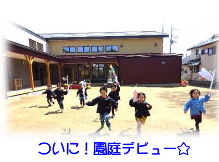
ついに!園庭デビュー☆