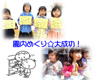
園内めぐり☆大成功!