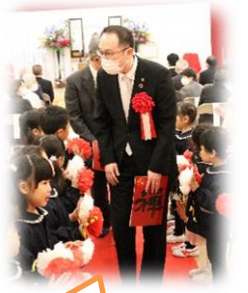
市長さんをお見送り